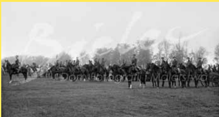
Parada wojskowa na Błoniach 3 maja 1939 r.