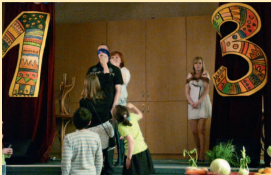
Wielkanocne spotkanie „Na Lea” – występy artystyczne