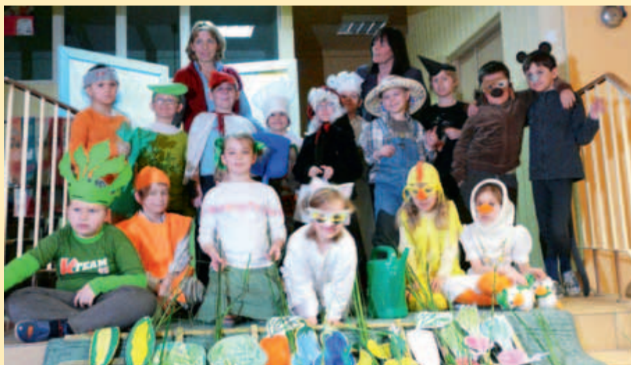
DT Pierwszaki czyli first class