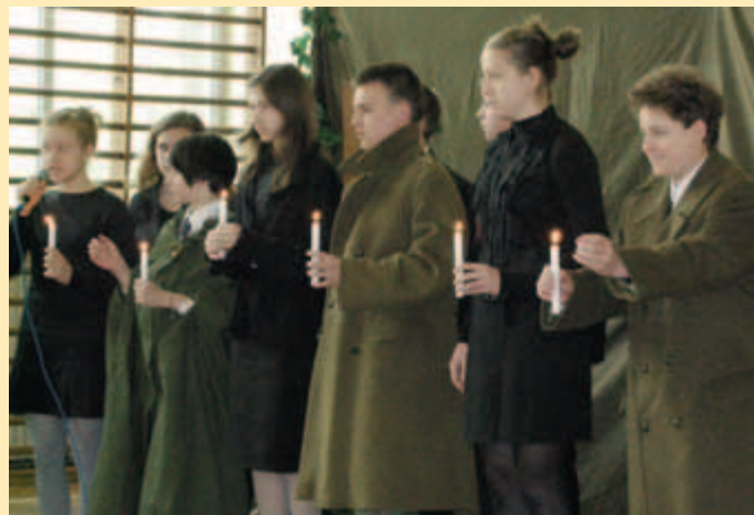
Młodzież ZSO nr 51 podczas programu słowno-muzycznego