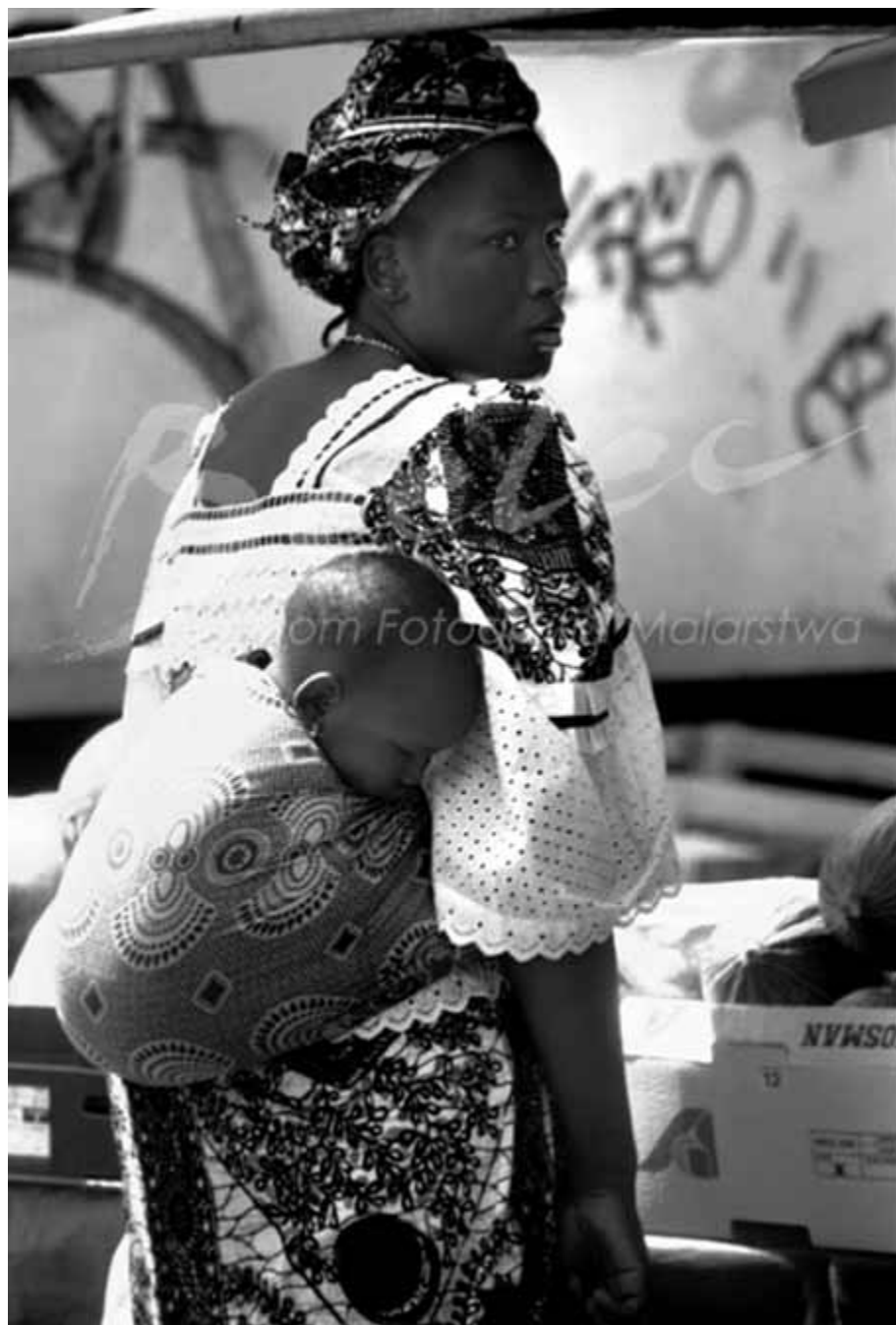
Cykl Miasto.

Tradycja fotograficzna w rodzinie Bieleców ma 110 lat. Zapoczątkował