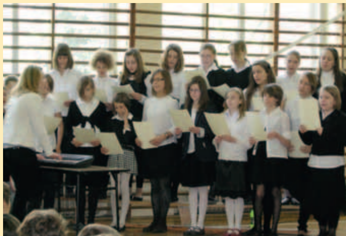
Pieśni patriotyczne zaśpiewał szkolny chór