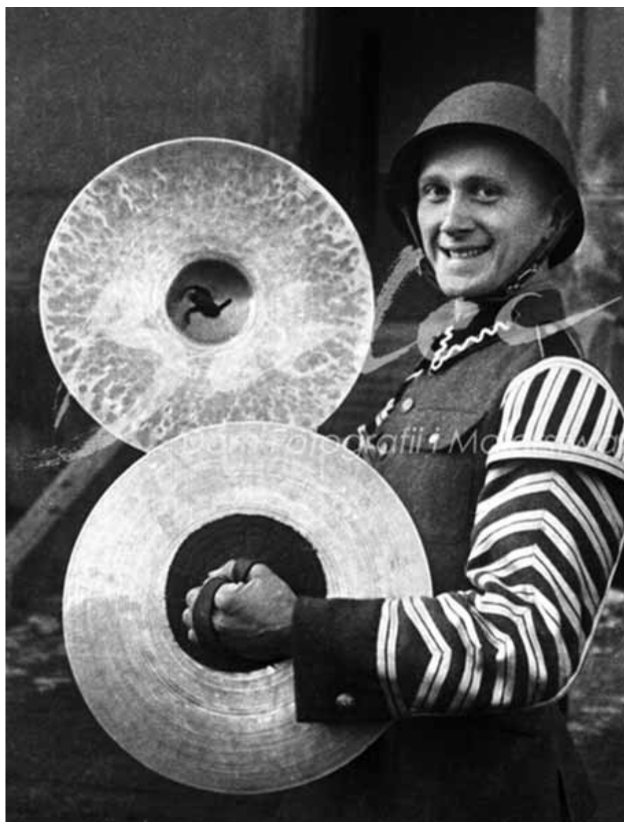
Żołnierz orkiestry wojskowej.