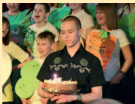
Urodzinowy tort. Trzynastka nie musi być pechowca!

Po radoszej części artystycznej przygotowanej przez siemachowców, modlitwie i poświęceniu pokarmów przez ks. Andrzeja, rozpoczął się uroczysty poczęstunek. Jak przystało na prawdziwe wielkanocne spotkanie, na stole królowały świąteczne przysmaki jajka, mazurki i lukrowane baby. Uczestnicy spotkania zgodnie z tradycją