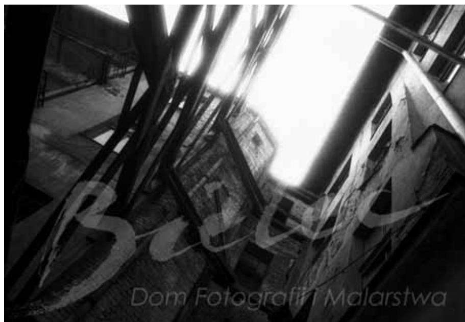
Cykl Kraków.