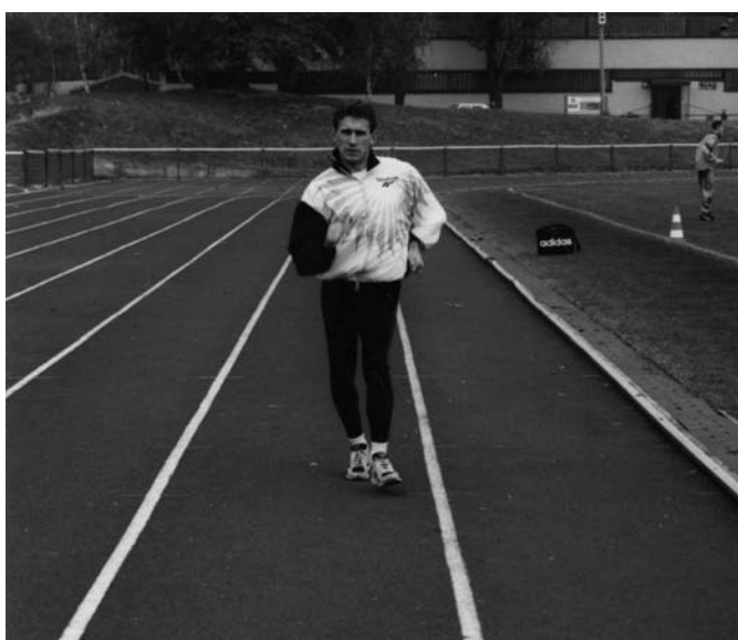
Multimedalista Robert Korzeniowski na bieżni Wawelu