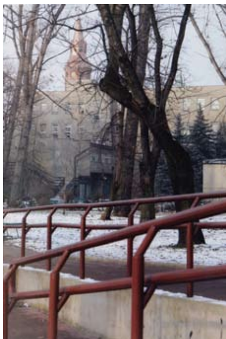
Wojciech Berniak – „Do kościoła”

16 stycznia 2008 r. został rozstrzygnięty konkurs fotograficzny „Krowodrza w moich oczach”. Na konkurs wpłynęło 45 fotografii, 15 autorów.