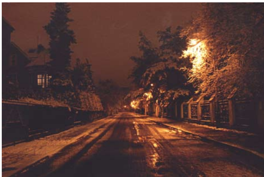
Krzysztof Śmigielski „Impresje na ul. Wyspiańskiego”