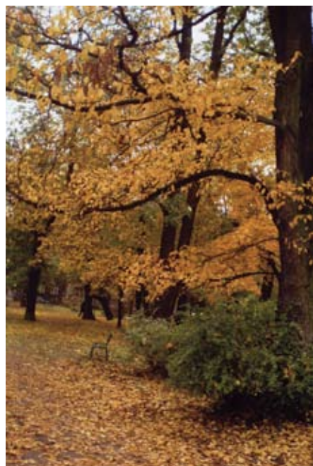
Zbigniew Bednarczyk – „Park Krakowski jesienią”