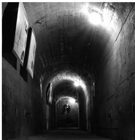
Schron w parku Krakowskim.

Maltańska Służba Medyczna Oddział Kraków ul. Aleksandry 1, 30-837 Kraków Dyżur: 18.00–19.30 (2. i 4. środa miesiąca) Komendant oddziału: tel. 791-009-113, Karol Wiecheć Kursy pierwszej pomocy: tel. 791-009-115, www.krakow.msm.org.pl