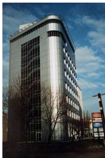
III miejsce: Antoni Kulczycki - „Krowoderskie mury rosą do góry”