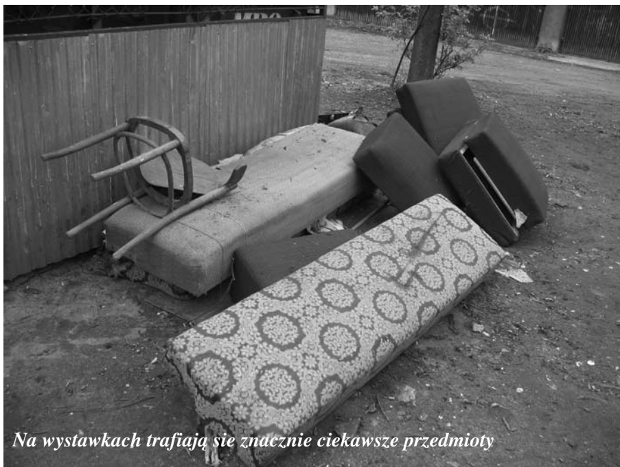
Na wystawkach trafiają się znacznie ciekawsze przedmioty

Tak więc, osoby poszukujące różnych elementów wyposażenia mieszkania,